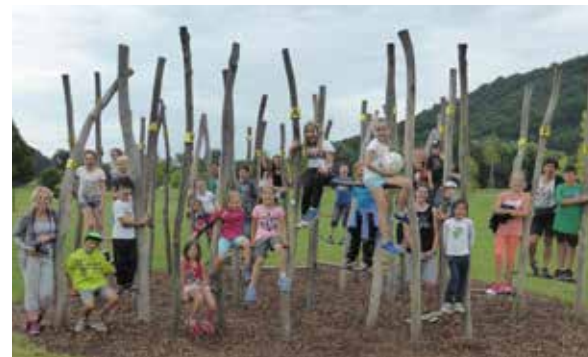
Aktivitäten in der Natur standen im Mittelpunkt