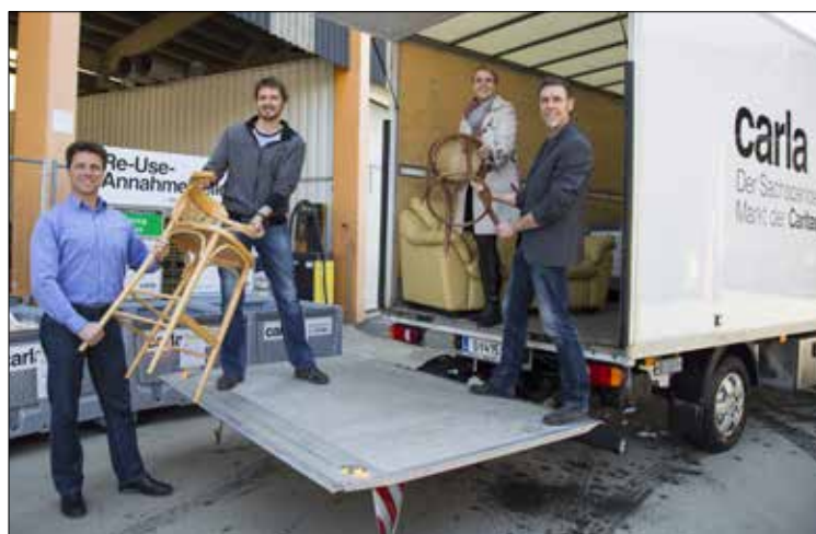
2014 wurde erstmals mit der ReUse-Aktion gestartet. Im Frühjahr wurde das Erfolgsprojekt fortgesetzt und findet im Herbst bereits zum dritten Mal statt

Nicht verwendbare Möbel werden kostenpflichtig entsorgt.