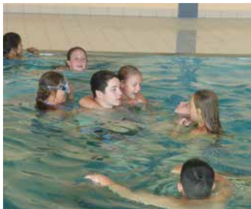
Natürlich darf der Besuch im Bad auch nicht fehlen