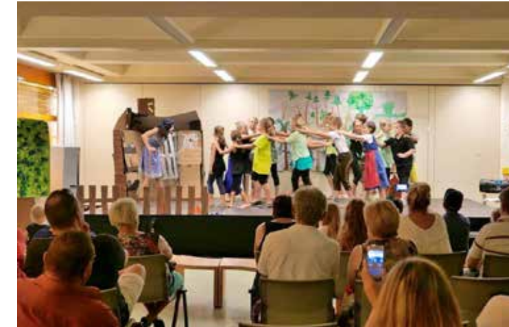
Gute Figur machten die Nachwuchsschauspieler schon nach einer Woche

Detaillierte Informationen zum Angebot, Preisen und Terminen erhalten Interessierte direkt unter 0664 4157388. Termine können von Montag bis Freitag von 8:00 – 18:00 Uhr und samstags von 8:00 – 12:00 Uhr vereinbart werden.