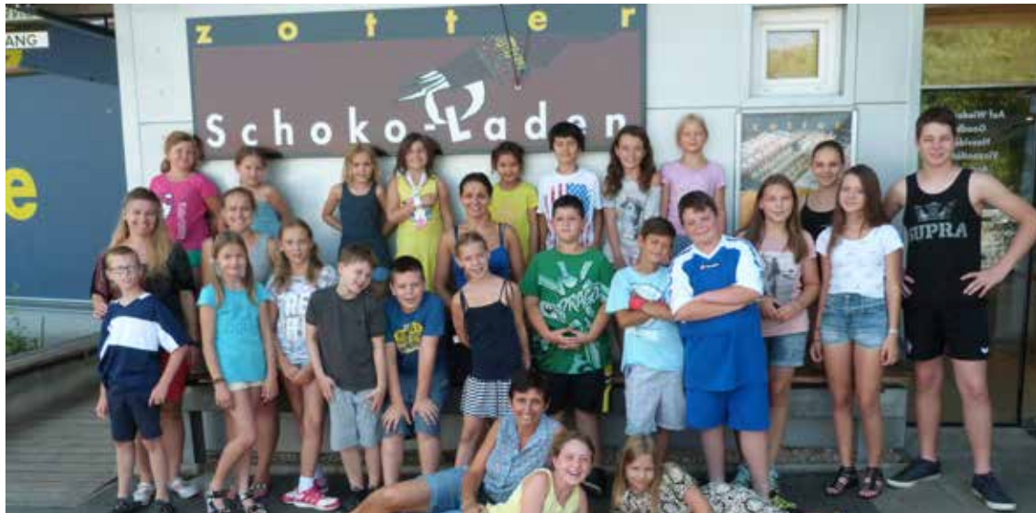
Süße Leckereien und interessante News über die Schokoladenherstellung gab es bei der Firma Zotter zu erfahren.

Auch im nächsten Jahr wird es eine gemeinsame Ferienurlaubswoche geben. Wohin die Reise der Teilnehmer dann geht, steht noch in den Sternen, jedenfalls in eine ganz andere Region.