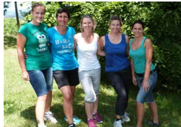
Das Betreuerinnen-Team 2015