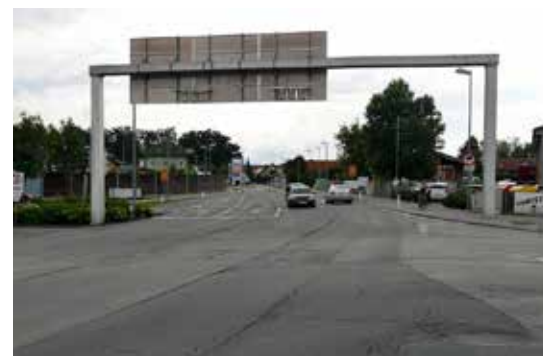
Kein Verkehrskollaps: 1 Stunde vor der offiziellen Eröffnung