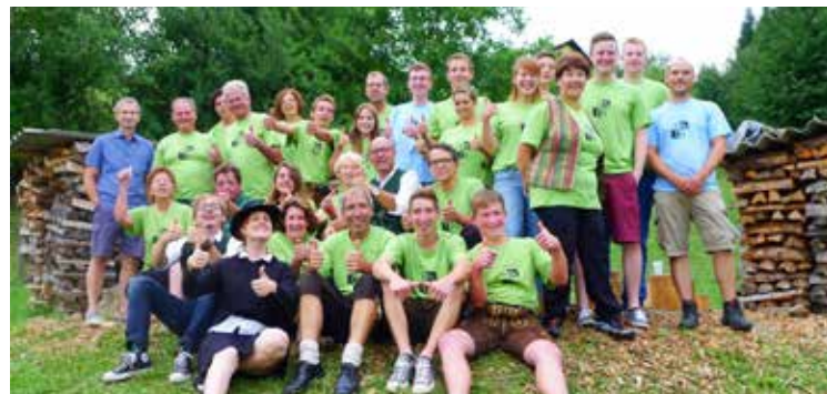
Viele helfende Hände machten den Erfolg möglich!