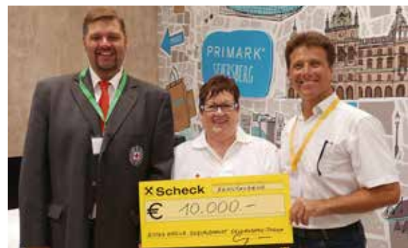
Hilfe für Helfer: € 10.000,- für den Sozialdienst