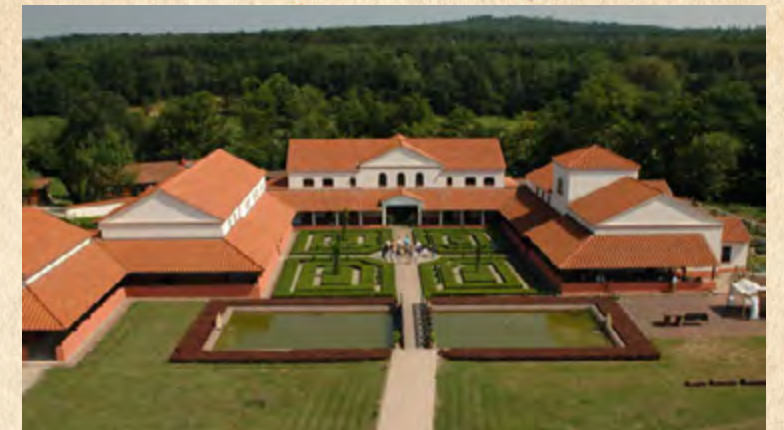
In derart noblen Villen lebten die Römer auch bei uns. (unser Foto zeigt eine Rekonstruktion aus dem Saarland)

Als im 8. und 9. Jahrhundert aus dem Südosten Slawen in das Gebiet vordrangen, fanden sie es fast menschenleer vor. Die neuen Invasoren brachten Ackerbau und Viehzucht mit sich, sodass Menschen wieder eine Lebensgrundlage hatten. Windorf gaben sie auch den Namen. Winden oder Wen-