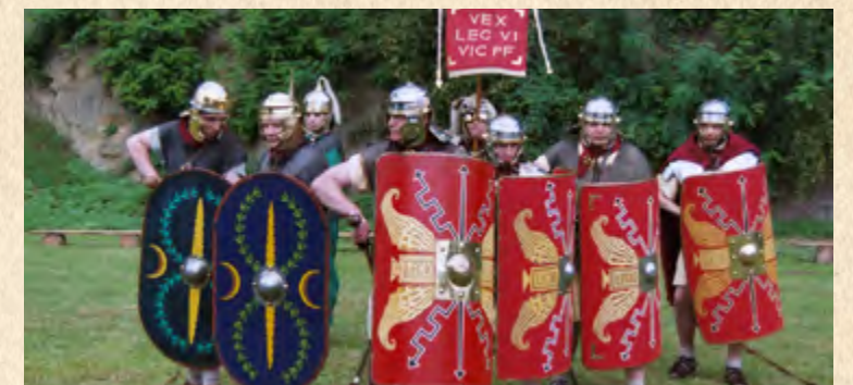
Schild, Lanze und Kurzsword: So waren die römischen Besatzungssoldaten ausgerüstet.

den nannte man die Slawen. Windorf war also eine Slawensiedlung.