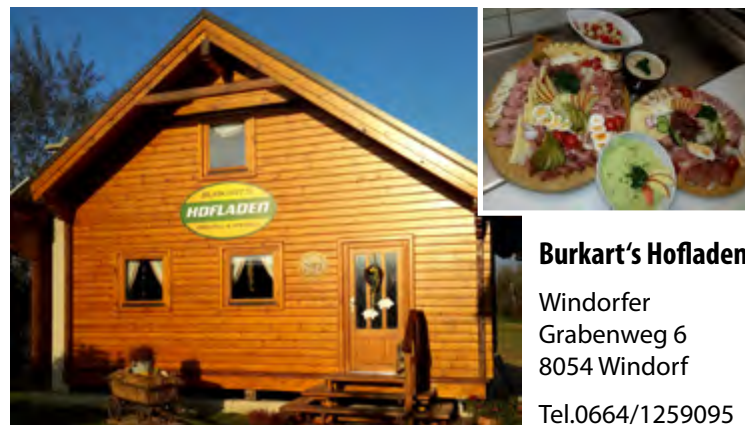
Burkart's Hofladen Windorfer Grabenweg 6 8054 Windorf Tel.0664/1259095

Die Singgemeinschaft CantiChorum gestaltet ein besinnliches Konzert zur Passionszeit mit Chorwerken aus verschiedenen Jahrhunderten. Der Bogen spannt sich vom euphorischen Einzug in Jerusalem über das letzte Abendmahl und die Kreuzigung bis zur aufkeimenden Hoffnung, die Jesu Kreuzestod vermittelt.