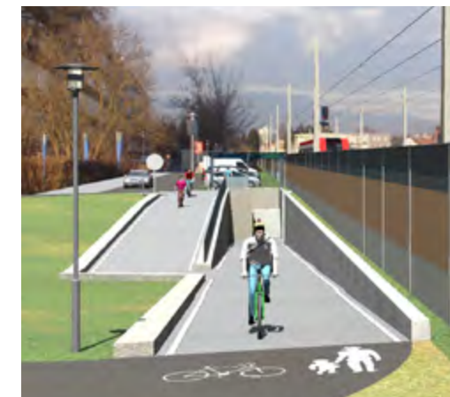
Bei einem zweispurigen Ausbau ist auch eine Lärm-schutzwand vorgesehen

Erst 2013 gab es in dem Bereich einen schweren Unfall, indem eine 84 jährige Frau von ihren beiden Hunden auf die Gleise gezogen und vom Zug erfasst wurde. Seither sichert eine Verkehrslotsin in der Schulzeit den Bereich, bis die Bauarbeiten abgeschlossen sind.