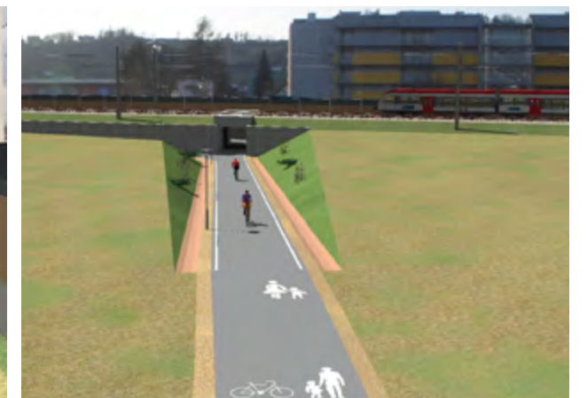
Damit wird auch der entlang der Straße verlaufende Radweg sicherer gemacht