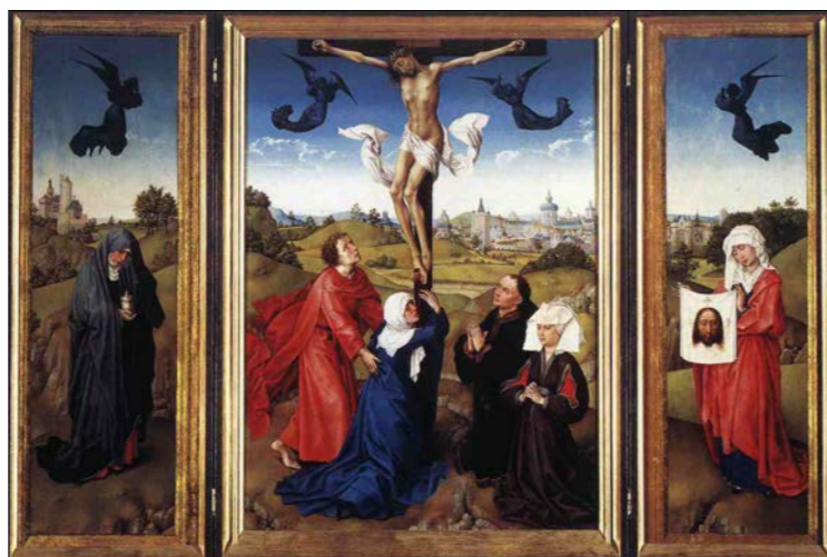
Trilogie auf Öl vom Martyrium Jesus Cristi

Antwort: In katholischen Kirchen bleiben Orgel und Glocken stumm. Letztere fliegen laut frommen Glauben sogar nach Rom. Zum Gottesdienst am Karfreitag wird mit knarrenden Ratschen gerufen. Einem am Gründonnerstag oder am Freitag gelegten Karfreitags-Ei wurden magische Kräfte zugeordnet.