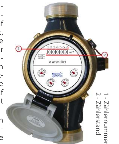
1 - Zählernummer 2 - Zählerstand

Die bequemste Art, den Wasserzählerstand bekannt zu geben, ist jene über die Gemeindehomepage. Einfach unter www.gemeindekurier.at oder wasser.seiersberg-pirka.gv.at das Formular ausfüllen und Zählerstand übermitteln. Dazu wird die Kontonummer