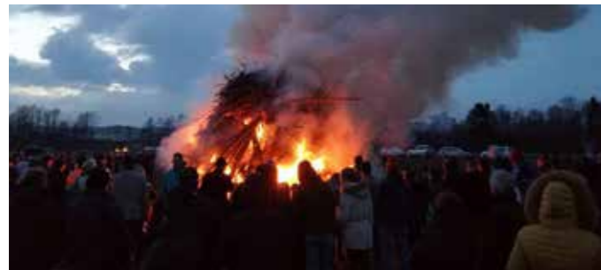
Osterfeuer 2018 der Landjugend